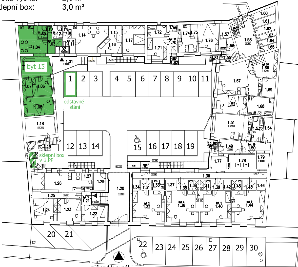
příjezd k areálu z ulice Dukelská